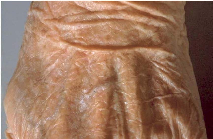
Hände lügen nie. Sie verraten das biologische Alter.

Mit der besseren medizinischen Versorgung erreichen die Menschen heute meist ein hohes Lebensalter. Auch die Haut, das empfindliche Schutzorgan des menschlichen Körpers muss mit dieser Entwicklung Schritt halten. Dabei zeigen sich an ihr die Alterungsprozesse am augenfälligsten. Sie verliert an Elastizität, ihre Schutzfunktion nimmt ab und damit reagiert sie auch sensibler auf äussere Reize.